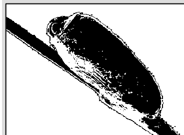
Abb. 2: Nisse mit Larve

Nissen können noch Monate nach erfolgreicher Behandlung nachweisbar sein.